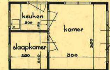
platte grond type 80 sch 1:100

Bij een binnenbekleding met triplex worden de buitenwanden veel gemaakt van 22 m.m. ruwe kantrechte deelen, welke gepotdeld op de stijlen worden aangebracht. Deze laten zich zeer goed carbolineeren en geven een rustig geheel en een dichte wand.